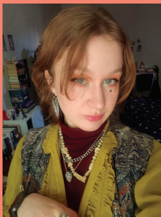
Арына Пранікава, пісьменніца, журналістка